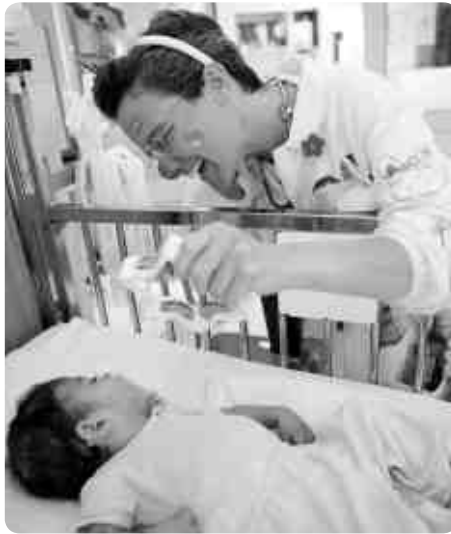
Die Clown-Therapie baut Ängste und Unsicherheiten der Kinder ab.

Dass die Geburt eines Kindes in Bethlehem vor 2000 Jahren schwierig war, wissen wir aus den Evangelien. Wegen der Situation in Palästina sind Geburten dort bis heute prekär. Ein Hoffnungs-schimmer inmitten von Gewalt und Terror ist das Caritas Baby Hospital.