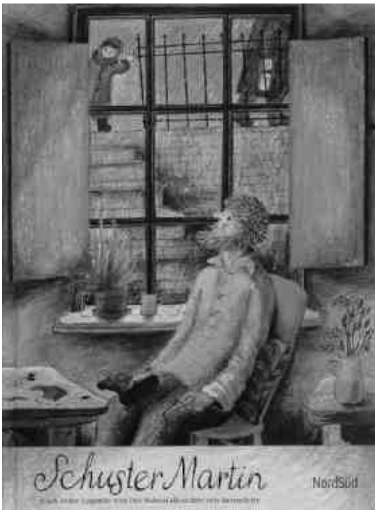
Bild aus dem Bilderbuch "Schuster Martin". Martin wartet ungeduldig auf Jesus.