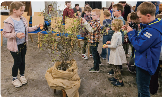
Kinder beim Osterstrauch schmücken

Die Osternachtsfeier begann um 21.00 Uhr in der Dunkelheit mit dem Osterfeuer. Von dort aus wurde die Osterkerze entzündet und in feierlichem Einzug in die noch dunkle Kirche getragen. Das Osterlob, erfüllte den Raum mit Hoffnung. Mit dem Gloria des Kirchenchors wurde es plötzlich hell: Glocken und Schellen erklangen und verkündeten die Auferstehung. Im Anschluss an den Gottesdienst wurde beim gemeinsamen Eiertütchen in der Kirche die Freude geteilt – denn gerade im Miteinander strahlt das Osterlicht besonders hell. Ein herzliches Dankeschön an alle, die den Weg von der Dunkelheit ins Licht eindrucksvoll mitgestaltet haben.