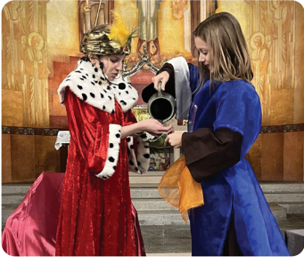
Pilatus wäscht seine Hände in Unschuld