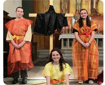
Frauen beim Kreuz