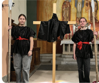
Soldaten beim Kreuz