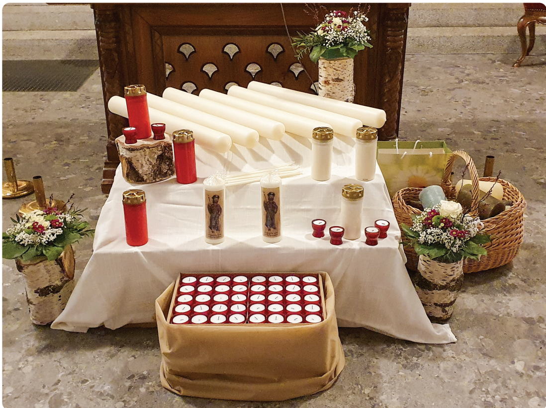
Foto: Kerzenssegnung Pfarrkirche Emmetten