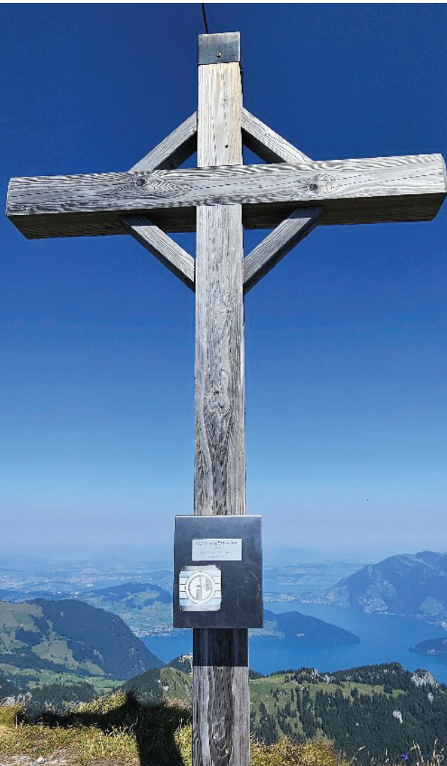
Bild: Kreuz auf dem Schwalms