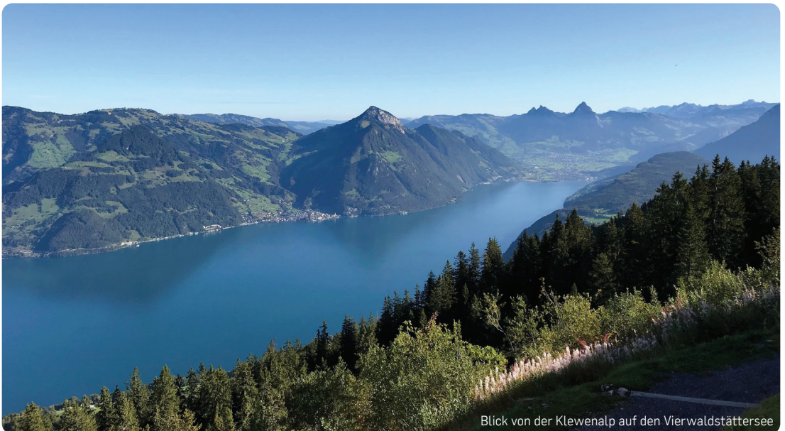
Blick von der Klewenalp auf den Vierwaldstättersee

Auch während der Sommerferien bleiben einige Möglichkeiten zum gemeinsamen Beten und Feiern bestehen: Jeden Samstagabend findet ein