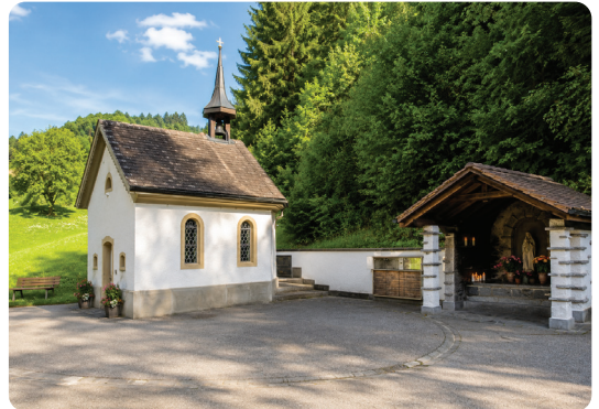
Wallfahrtsort Luthern Bad mit Badbrünkli-Kapelle