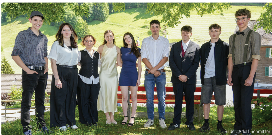
Bilder: Adolf Schmitter