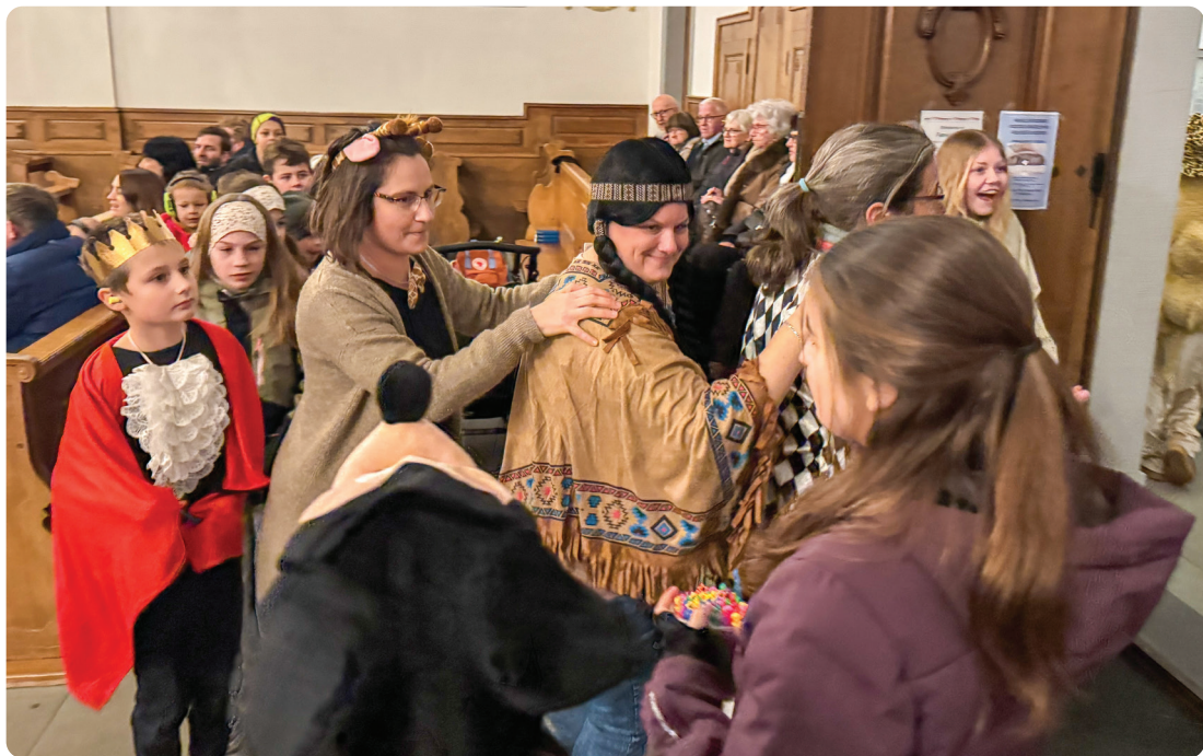
Die Fasnächtler verlassen das Fest...

Als ich im Jahr 2005 in die Schweiz kam, durfte ich wenige Monate später zum ersten Mal die Fasnacht miterleben. Mit einer christlichen Gruppe aus Bern stand ich im Februar 2006 auf der Kramgasse, verkleidet als Clown, und verkaufte Hotdogs und Glühwein. Um uns herum: fröhliche Menschen, farbige Kostüme, Guggenmusik, Konfetti – eine ausgelassene, beinahe überbordende Stimmung.