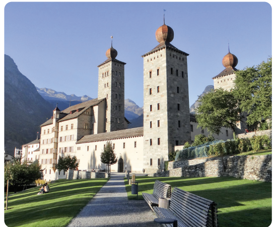
Bild Stockalperschloss: Geri340 - Own work, CC BY-SA 4.0, https://commons.wikimedia.org/w/index.php?curid=73015896

Interesse? Dann melden Sie sich bei Astrid Biedermann unter pfarreileitung@kirche-emmetten.ch / Tel. 077 508 57 90.