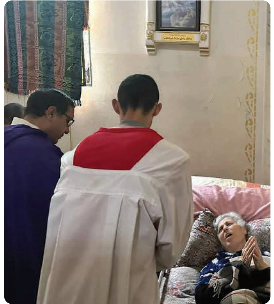
Seelsorge unter prekären Verhältnissen: Eine Frau in Gaza empfängt die Krankenkommunion

Die palästinensischen Autonomiegebiete gehören mit Israel, Zypern und Jordanien zum Lateinischen Patriarchat von Jerusalem. Bischof ist seit Oktober 2020 der Franziskaner Pierbattista Pizzaballa. Papst Franziskus nahm ihn im September 2023 ins Kardinalskollegium auf. Pizzaballas Titelkirche (=Pfarrkirche in Rom, die jeder Kardinal ehrenhalber erhält) ist Sant'Onofrio al Gianicolo. Informationen zum Patriarchat und zur Pfarrei «Holy Family» in Gaza gibt es unter www.lpj.org .