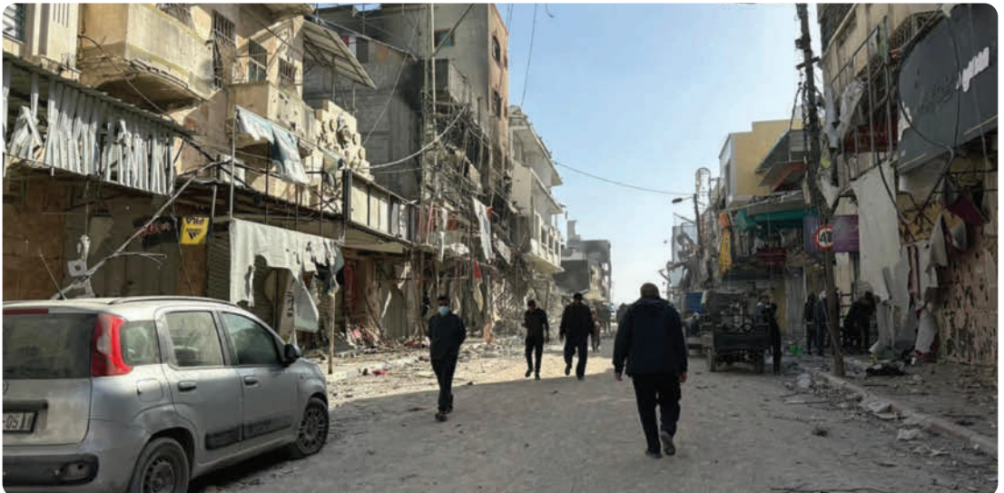
Ein zerstörter Strassenzug in Gaza

Die Lebensmittelversorgung ist sehr, sehr eingeschränkt. „Das Problem hat nichts mit verfügbarem Bargeld zu tun“, erklärt dieselbe Quelle. „Es ist einfach so, dass die Lebensmittel knapp sind und es schwierig ist, sie irgendwo zu finden“. Und: „Die christliche Gemeinschaft ergreift jede Gele-