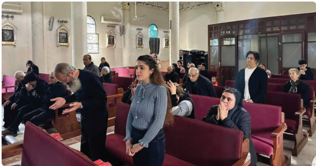
Christen lassen es sich trotz allem nicht nehmen, in der Pfarrkirche regelmässig zur Messe zusammenzukommen